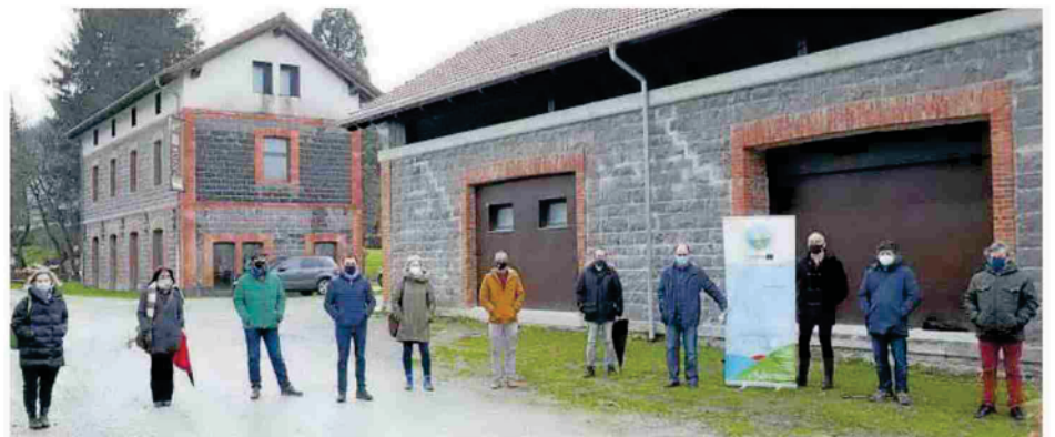
Dentro de las actuaciones llevadas a cabo en el entorno de Edebidea se ha rehabilitado el almacén de Leizta.

Obras Públicas con cámaras térmicas para la videodetección de bicicletas y peatones y espiras magnéticas para la detección de vehículos. ●