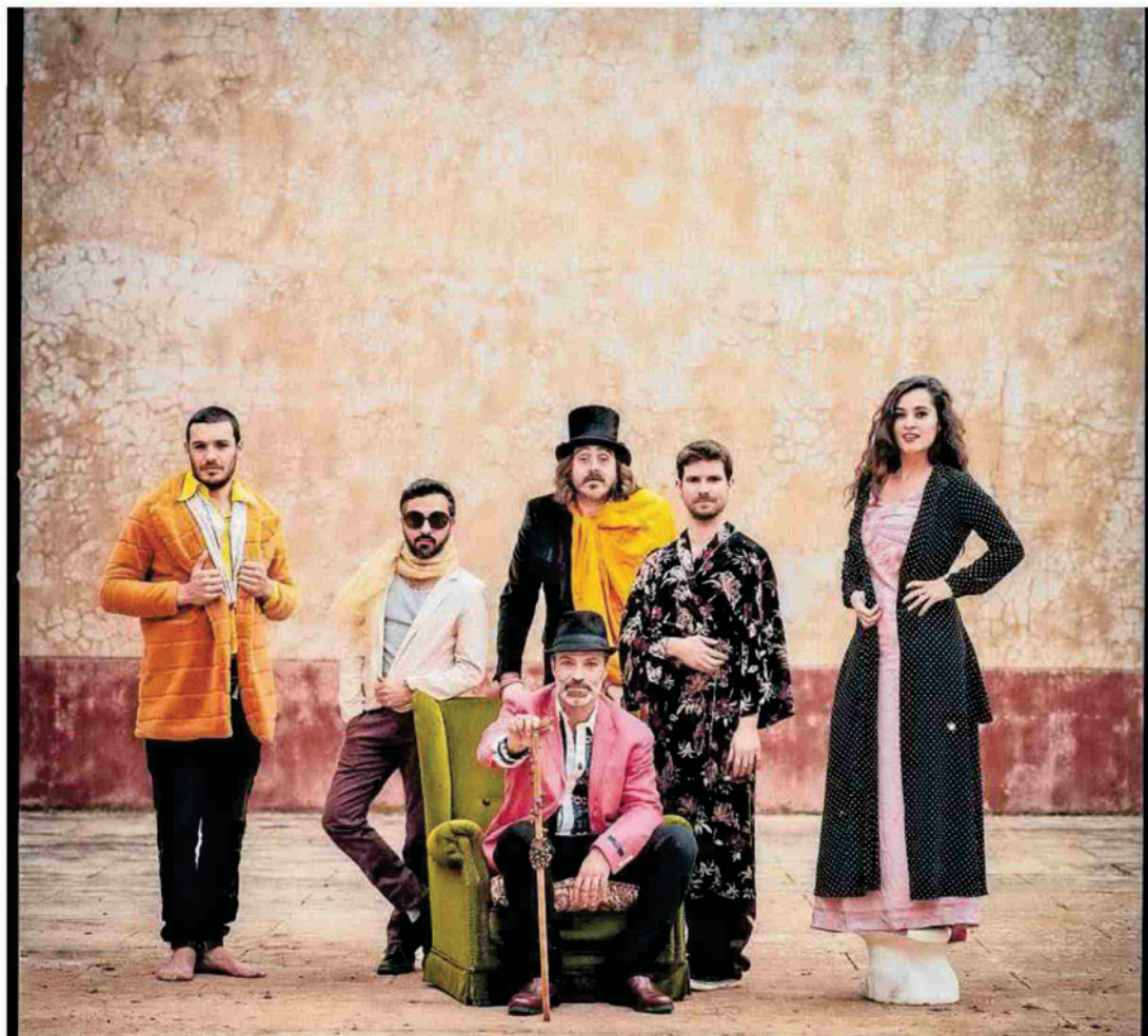
Silvia Pérez Cruz será uno de los platos fuertes de la edición del Festival de este año.