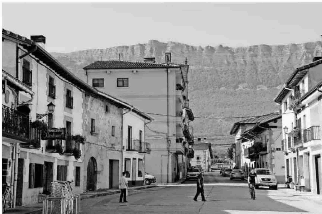
Vecinos de Uharte Arakil con la sierra de Andía de fondo.