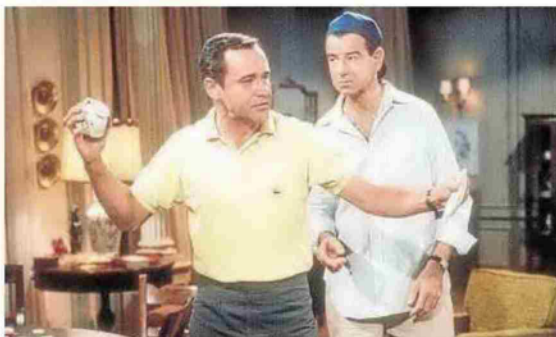
'La extraña pareja'.