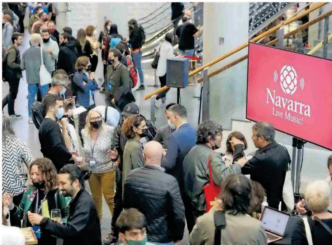
Presentación de la iniciativa Navarra Live Music! en el encuentro BIME PRO.