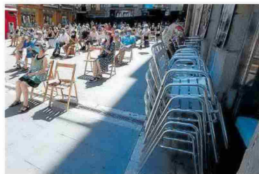
Una de las terrazas de la plaza del Ayuntamiento, recogida.