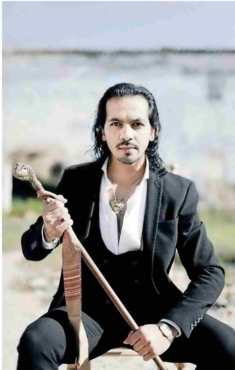
El bailaor Farruquito.

El bailaor presenta hoy a las 21.30 horas en Baluarte el espectáculo ‘Íntimo’, con Remedios Amaya como invitada. Últimas entradas a la venta –38 y 28 euros–