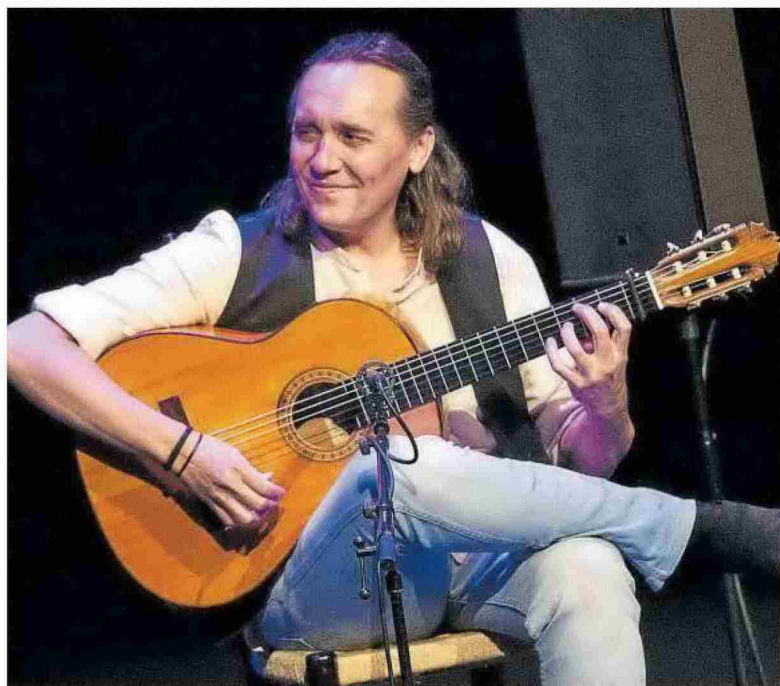
Vicente Amigo ayer en el recital que ofreció en Baluarte.