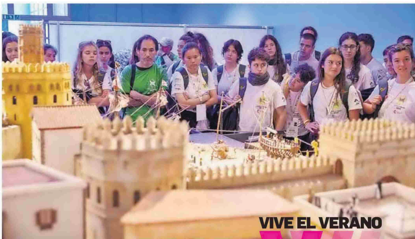
Los jóvenes del Proyecto 'Vuelta al Mundo' atienden a la explicación sobre cómo se realizó la maqueta de la Torre del Oro y los edificios adyacentes.