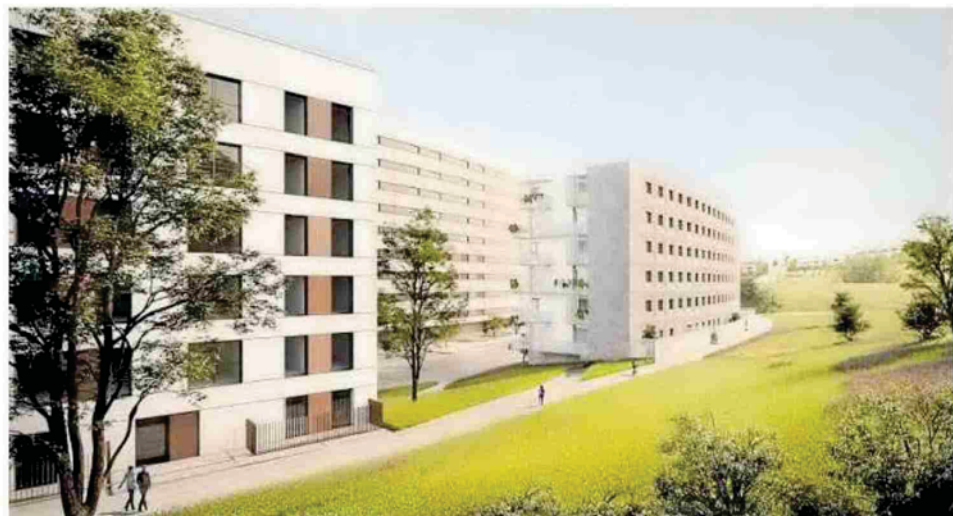
Recreación de las futuras viviendas junto al parque.

que el Ejecutivo actual ha buscado “el máximo consenso” para introducir cambios en el plan inicialmente previsto. Así, de las cerca de 200 viviendas que se iban a construir en la ripa, serán finalmente 93 las que se edifiquen. Además, se ha modificado su ubicación, para que queden ubicadas junto a la acera y no a mitad de ladera. El consejero justificó que, pese a que sea en menor número, se mantenga la construcción de vivienda social de alquiler en esta zona.