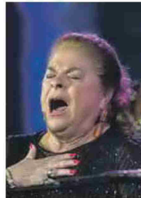
La Paquera de Jerez.

Mañana sábado, el protagonista será el cantaor Terremoto de Jerez, con la proyección de un docu-