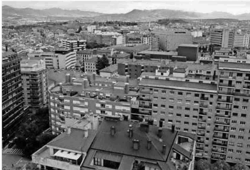
Vista del Ensanche y Casco Viejo de Pamplona, desde el Edificio Singular.