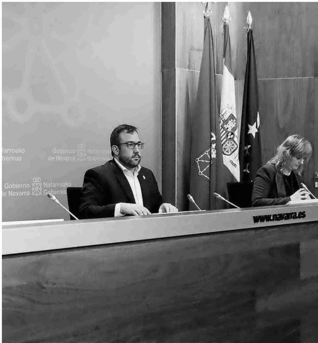
Olo, separados con la distancia preventiva de seguridad, en la rueda de prensa de ayer.