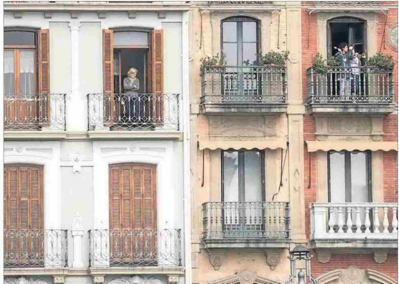
Iruñeko Alde Zaharreko etxebizitzak.

Gipuzkoa da Hego Euskal Herrian etxebizitza garestienak dituen herrialdea, alokatutako metro karratuko 14,99 euroko prezioa dute. Donostiako udalerrian, berriz, 15,97 euro ordaintzen dira batez beste.