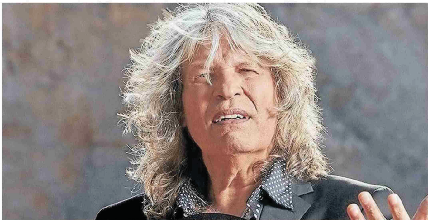
El cantaor jerezano José Mercé, en una imagen de archivo.

El cantaor de Jerez presentará mañana en Baluarte su último trabajo, 'El Oripandó', que asemeja a ser su biografía cantada. Últimas entradas a la venta, entre 30 y 40 euros