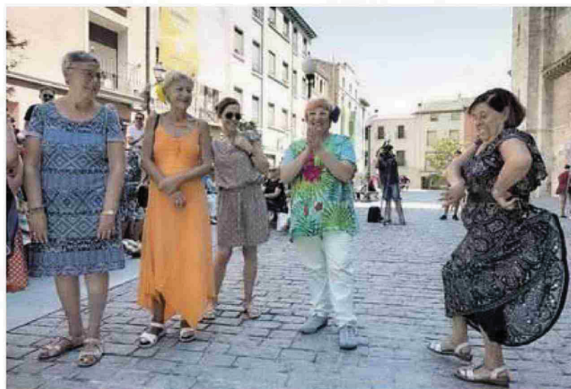
EN LA PLAZA VIEJA Los sones flamencos que salieron desde el balcón de la Casa Consistorial contagiaron a los espectadores que siguieron las actuaciones desde la plaza Vieja llegando a hacer bailar a la mujer de la foto. B.A.