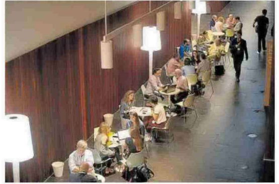
Participantes en la tercera edición de Conecta Fiction.

"fiel a su espíritu de puente de conexión profesional pero muy consciente de las grandes dificultades actuales", ha realizado un amplio sondeo entre ejecutivos participantes en ediciones anteriores y, una vez evaluados los resultados, ha decidido "optar por la celebración de un evento híbrido donde habrá cabida para todos los profesionales, tanto los que puedan participar en el encuentro en Pamplona, como para aquellos que participen de forma virtual debido a los protocolos de seguridad de sus empresas o países y no puedan tener otro tipo de acceso que la vía digital.