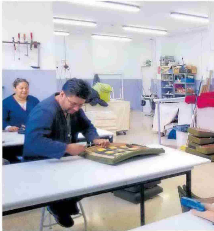
Trabajadores realiza sus labores en una tapicería dentro de un programa