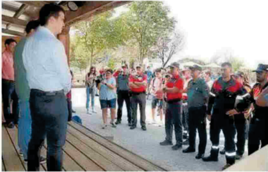
El consejero y el gerente se dirigen a Policía, Guardia Civil y Bomberos.