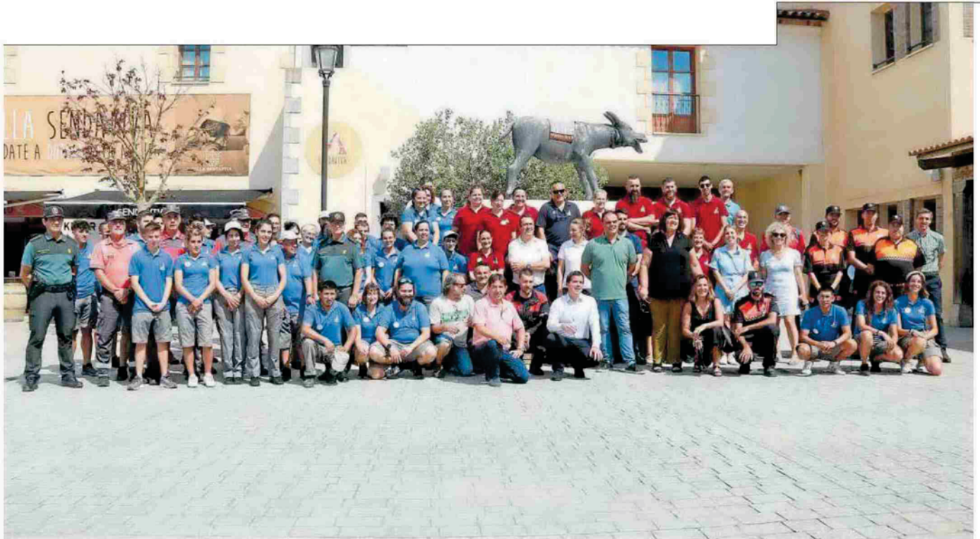
Todos los que tuvieron un importante papel en la lucha contra el incendio del pasado 18 de junio posaron ayer antes de abrir las puertas de Sendaviva.