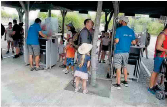
Los visitantes, en la entrada a Sendaviva.