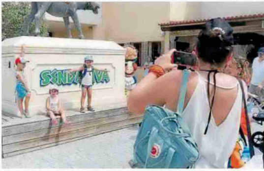
Una familia se hace una foto a la entrada de Sendaviva.