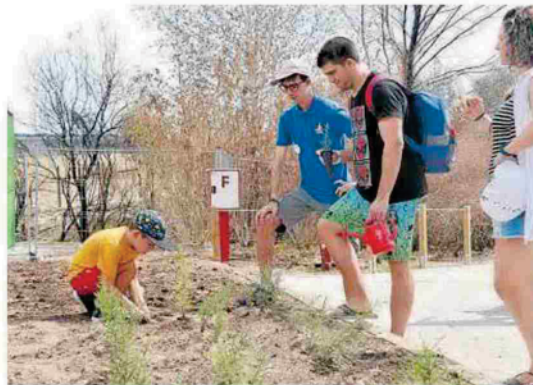
Un niño ayuda en la plantación de árboles a la entrada.

entorno y sus instalaciones. También, por último, compromiso del parque, porque según aseguró ayer su gerente Rubén González, “hemos podido mantener todos los puestos de trabajo, era una obsesión del parque y volvemos a nuestro ritmo y esperando que sea un verano bueno para todos”. Sendaviva reanudó ayer su actividad con la apertura de sus puertas al público, de manera parcial, sin las atracciones que estaban en el bosque y centrados en actividades acuáticas y los animales. Una temporada que desde el parque se afronta “con ilusión y con una apuesta por las atracciones de agua como principal reclamo para el público familiar en los meses de verano, así como nuevas actividades que buscan concienciar sobre el cuidado y respeto al medio ambiente”. De hecho, los visitantes pueden tomar parte en la reforestación del entorno o conocer de prime-