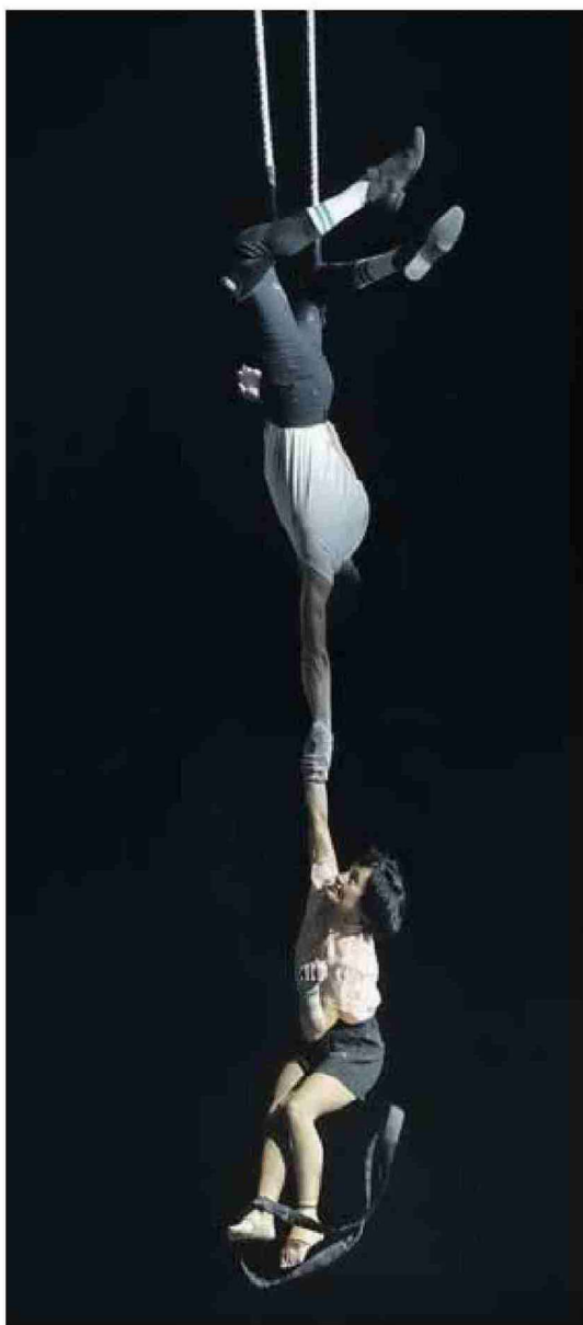
Un momento de la actuación de los equilibristas Ho Fem Fatale.