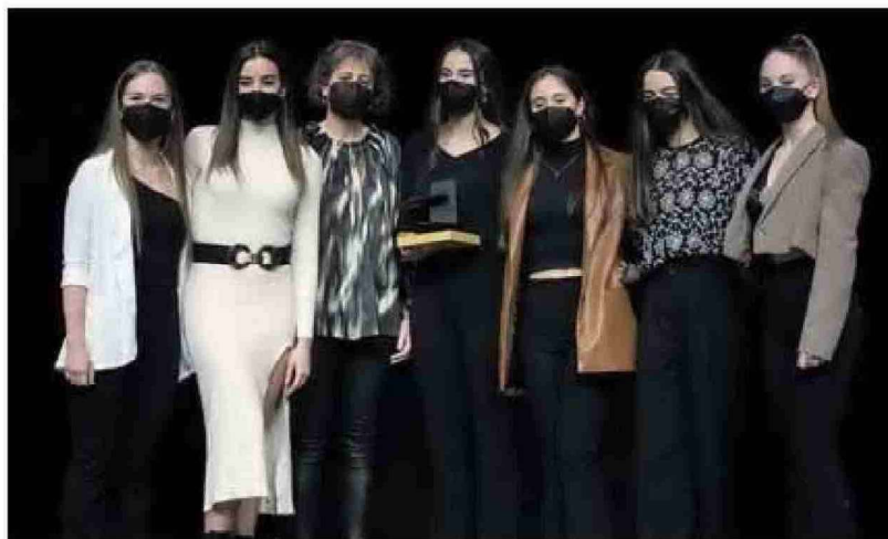
Las deportistas y entrenadoras del Club Rítmica Alaia, junto a la consejera Esnaola. JESÚS CASO

Las gimnastas reconocieron: "Dedicamos muchas horas de trabajo y mucho esfuerzo pero gracias al apoyo de la familia y entrenadores es más fácil hacerlo".