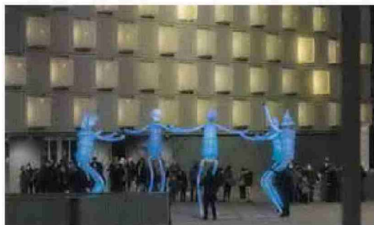
Actuación de 'Big Dancers' en las afueras del Navarra Arena.