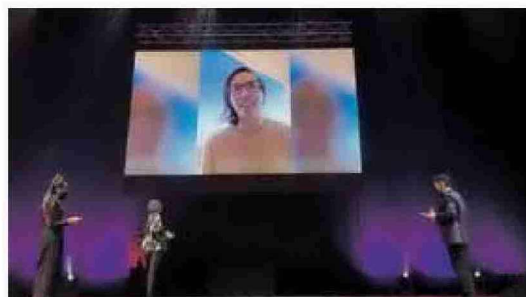
Ciganda envió un mensaje agradeciendo el premio. JESÚS CASO

ta agradeció en la distancia el reconocimiento: "Estoy muy orgullosa y contenta por recibir este premio. Me gustaría felicitar a todos los premiados. Me enorgullece mucho ser la mejor deportista navarra y creo que todos estaréis tan orgullosos como yo. No he podido estar esta noche ahí pero mis padres sí, así que les doy las gracias y ahora a seguir trabajando con muchas ganas por ver cómo se dan las cosas este año", afirmó.