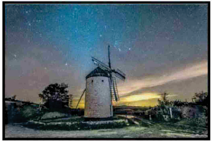
Aspas y estrellas , tomada en la sierra de Guerinda por José Antonio Barros, tercer premio.