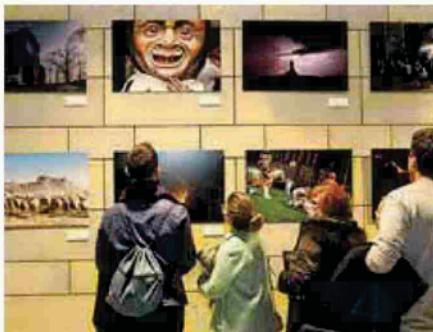
Imagen de la exposición del concurso de 2017.

La entrega de los premios se realizará durante la presentación de la revista nº 61 de Conocer Navarra , que se celebrará el 16 de diciembre en el Refectorio de la Catedral de Pamplona. En este mismo acto se inaugurará la exposición con las 30 imágenes finalistas. Estas mismas fotografías ilustrarán el calendario que será entregado gratuitamente en el mes de diciembre tanto con Diario de Navarra como con la revista Conocer Navarra .