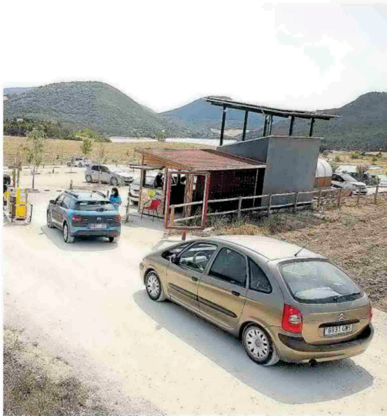
Dos coches en la entrada al parking regulado de la bahía de Ugar.

Red Explora también pretende sensibilizar y fomentar entre la población buenos usos, hábitos y actitudes responsables en el disfrute del medio rural de Navarra. Para ello, han lanzado este verano la campaña ¿Dónde va Vicente? / Maritxu, nora zoaz? , que abarcan distintos aspectos