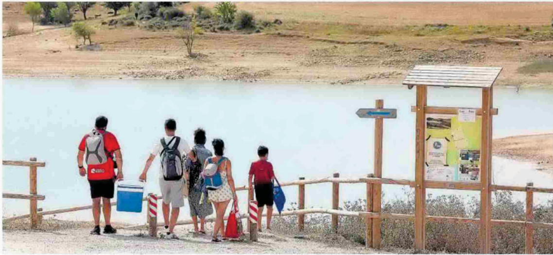
Una familia, equipados con neveras y mochilas, bajan a la bahía de Ugar.