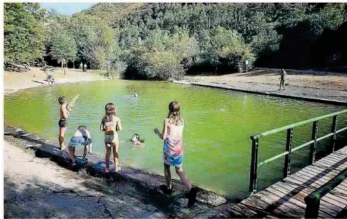
Cinco niños y niñas en la orilla de la foz de Benasa.