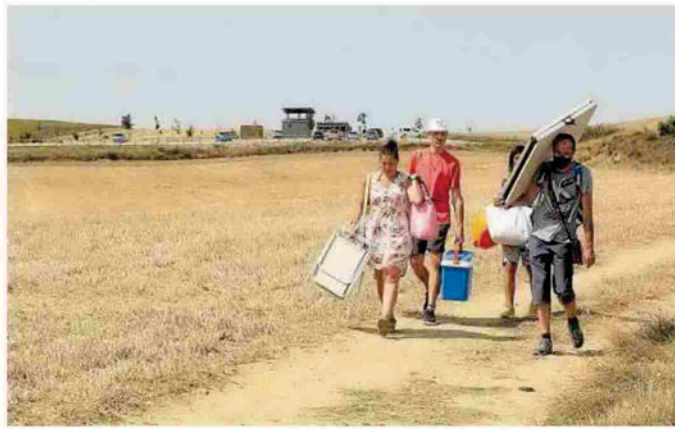
Una familia se dirige a la bahía de Ugar con una mesa, una nevera y una silla.