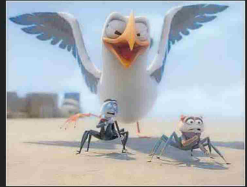
Los personajes principales vivirán todo tipo de peripecias.