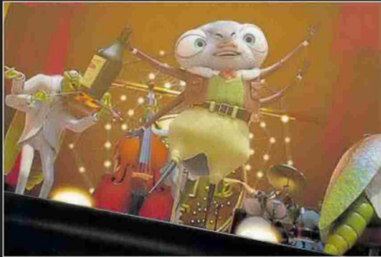
Una divertida escena de la película.