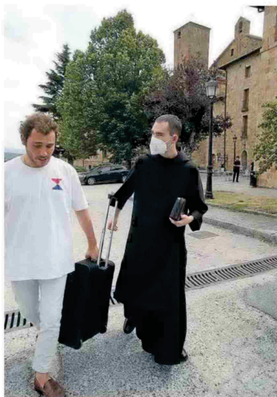
Uno de los monjes del monasterio de Leyre sale ayer del lugar.

Lago las atracciones están en perfecto estado. Tampoco se vio afectada la zona de Las aves . El parque reembolsará el dinero de las entradas tanto para las personas desalojadas como para las que no pudieron ir el domingo. ●