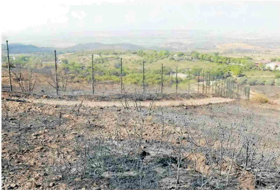
La parte baja de Sendaviva aparece casi intacta, vista desde la parte de arriba cuya vegetación e infraestructuras fueron calcinadas.

“Cuando cerramos todo y llegó el fuego pensé, no sé si vamos a volver a trabajar aquí”