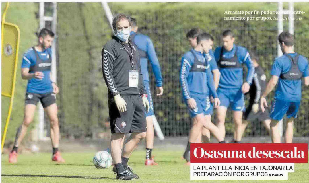
Arrasate por fin pudo reanudar entrenamiento por grupos.