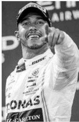
Hamilton, campeón en 2019.

Con la drástica decisión de suspender la carrera china, la F1 sale del largo letargo de invierno bajo los efectos que está motivando que muchos sectores se tomen medidas extremas para evitar contagios, y sin ir más lejos, Barcelona también se ha visto afectada por una decisión contundente, como ha sido la suspensión del Congre-