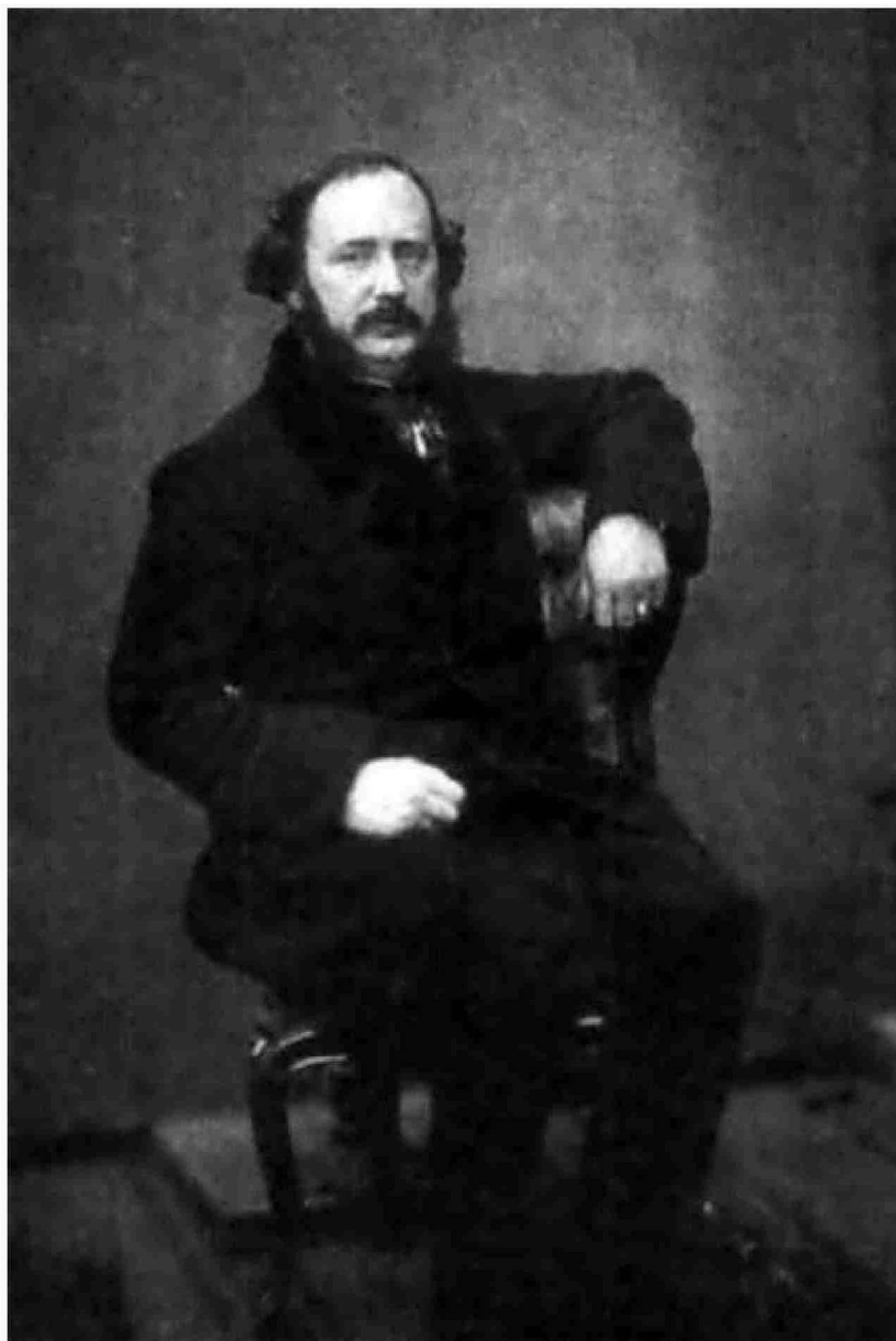
Retrato de Emilio Arrieta realizado hacia 1860, cuando el compositor rondaba los 40 años de edad.