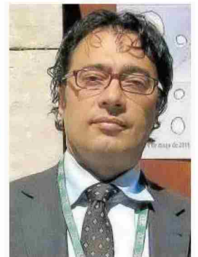
Miguel González.