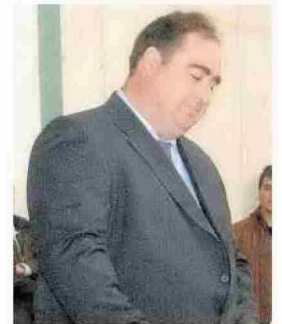
Germán Jaurrieta.