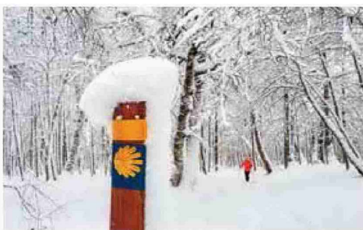
Camino invernal de Santiago.