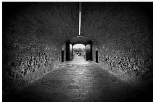
Entrada a la Ciudadela.