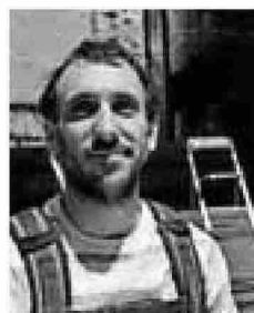
NANO NAPAL 'QUIMERA'

"Son textos e imágenes muy potentes, nacidos del dolor de la Guerra Civil"