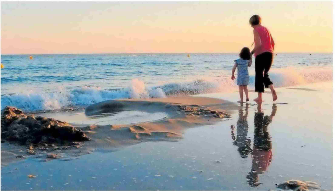
Menorca es el destino invitado en esta decimoctava edición. CEDIA.