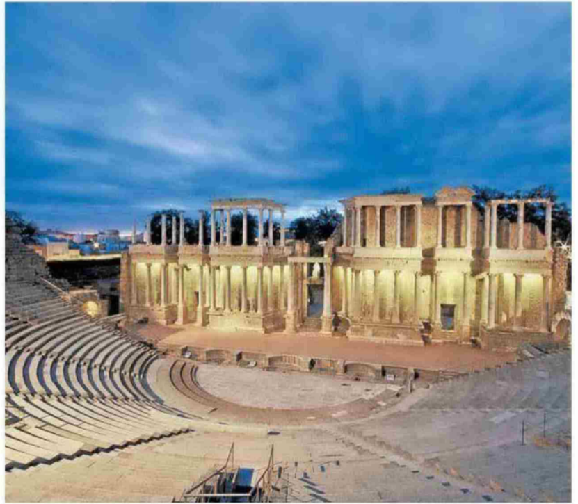
Teatro Romano de Mérida, uno de los grandes atractivos para visitar en Extremadura.

Con este evento de apoyo a la comercialización, esta feria pretende colaborar a situar Navarra entre los destinos más deseados para los visitantes internacionales, "posicionando sus productos, servicios y experiencias turísticas en los más rentables mercados emisores como son el estadounidense, canadiense o británico", concluye Cortés. ■