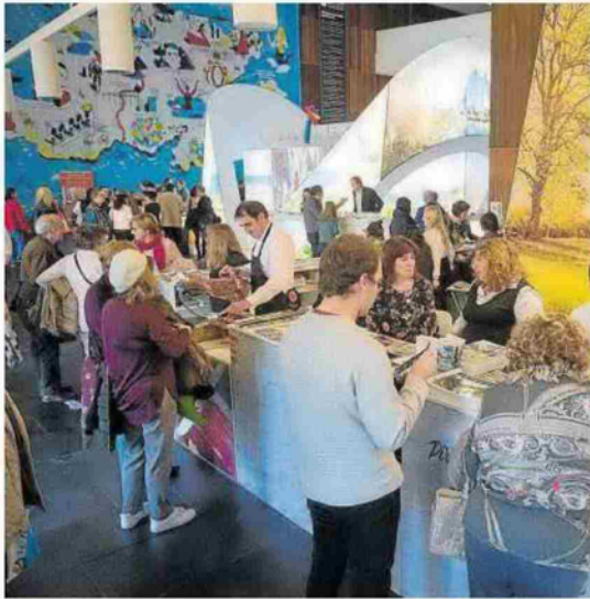
Asistentes a la feria Navartur en 2023.

Cortés indica que se observa una preferencia por viajar en familia o en pareja, así como un aumento en la demanda de experiencias de lujo, señalando que "incluso, a pesar del aumento del coste de la vida, los consumidores de rentas altas siguen siendo resistentes a la presión de los precios".