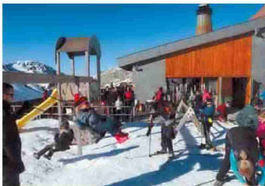
El sol animó el uso de la terraza y columpios del refugio de El Ferial.