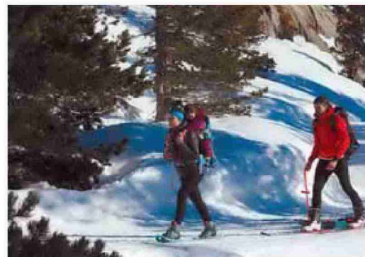
El empleo de raquetas de nieve va ganando adeptos.