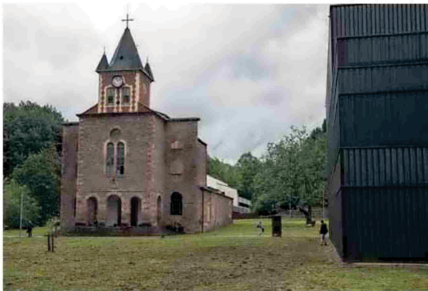
Exterior de la iglesia del desaparecido colegio de Lekaroz.

La nave central estará equipada de recursos a disposición no sólo de las empresas radicadas en el campus, sino también para que otras pueda poder llevar a cabo "talleres, reuniones y congresos". En este capítulo de celebración de encuentros profesionales, el albergue del Centro de Inmersión de Lekaroz, situado en las inmediaciones, proporcionará alojamiento. "El proyecto cuenta con la colaboración de CEIN y de la Unidad de Innovación Social para el acompañamiento a los emprendedores, así como de las empresas instaladas en el Campus