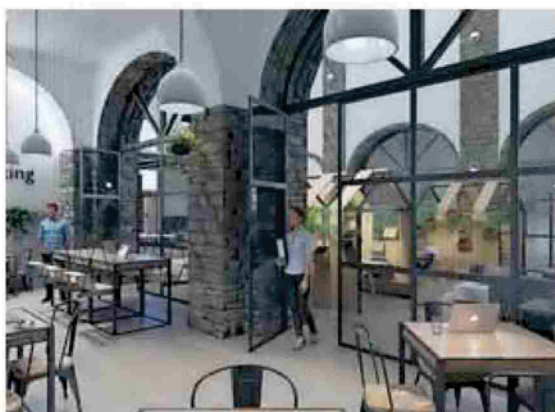
Recreación del modelo de vivero de empresas.