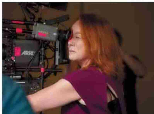
Gracia Querejeta es la codirectora de la serie.

Ana Tramel. El Juego es un thriller , una serie de investigación judicial en el que intervienen también Israel Elejalde, Natalia Verbeke, Unax Ugalde, Luis Bermejo, Ismael Martínez, Juanma Cifuentes y María Zabala. Cuenta la historia de una brillante abogada penalista que vive sus horas más bajas. Una llamada de su her-