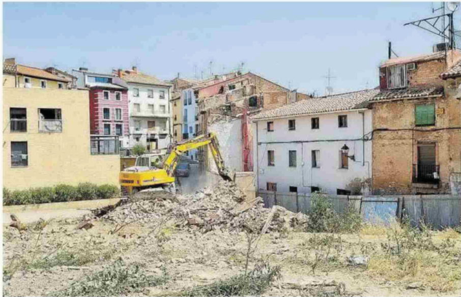
Primeros trabajos de demolición de la zona de Coscolín, que comenzaron el pasado 4 de agosto.