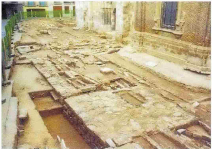
Aspecto de los restos de la mezquita (1993) en la plaza Vieja con la base del minarete.

que no se urbanizó en época islámica. Los restos encontrados eran de viviendas y zonas domésticas de trabajo con depósitos recubiertos de cal y una hoz. No eran zonas palaciegas pero teniendo esa amplitud de 200m2 podremos ver el urbanismo de época islámica con bastante nitidez cosa que es raro poder ver en Tudela. Esperamos que aparezcan adarves, salas principales, zonas de trabajo, patios con sus alcorques para árboles". A tenor de lo visto en las catas podrían aparecer "viviendas de gente acomodada, no palaciegas ni de gente muy pobre", que vivían en los alrededores de la mezquita mayor de Tudela. El templo musulmán fue reconvertido en el siglo XII en la catedral de Tudela y para ello se emplearon hasta 127 elemento, y no solo modillones. Es el segundo templo de la península que más elementos reutilizó, tras Córdoba. Si bien allí eran in situ y aquí se desplazaron. Bienes y Sola esperan llevar a cabo los trabajos durante 4 meses, a los que seguirán otros 4 meses de trabajo en laboratorio, pero ya fuera del lugar. "Aun hay que presentar el proyecto de intervención arqueológica que no hizo el