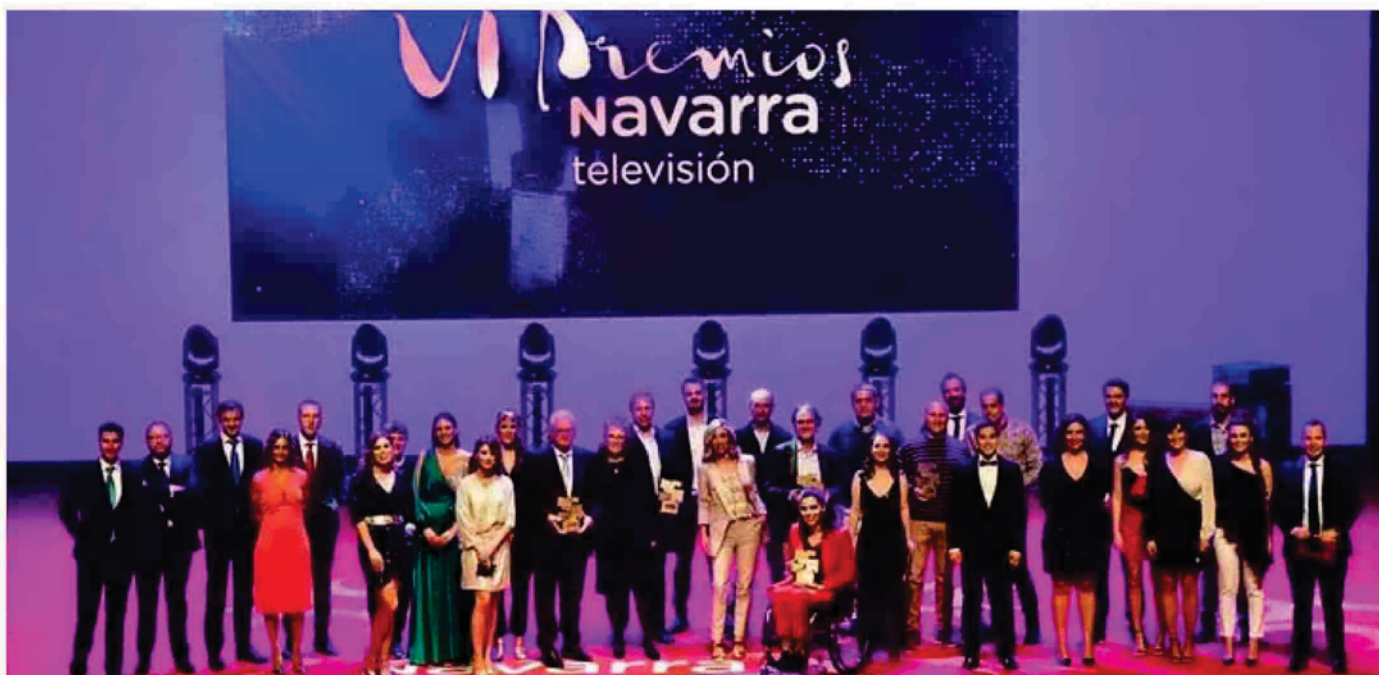
Premiados y presentadores de Navarra Televisión posan en el escenario de Baluarte.