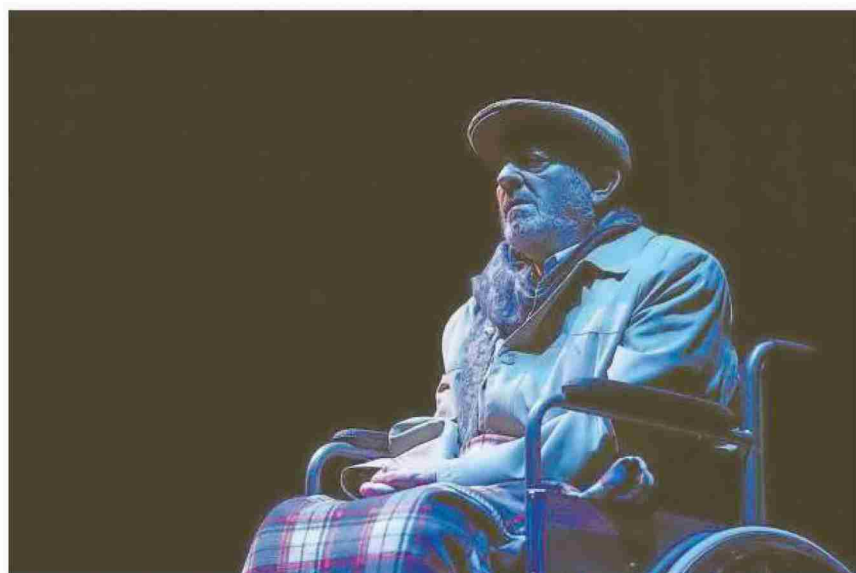
Sobre estas líneas, una escena de la obra 'En la perrera', de Átikus Teatro. A la derecha, 'Loco desatino', de Producciones Maestras (arriba), y 'Aita', de la Compañía Profesional de Laura Laiglesia.