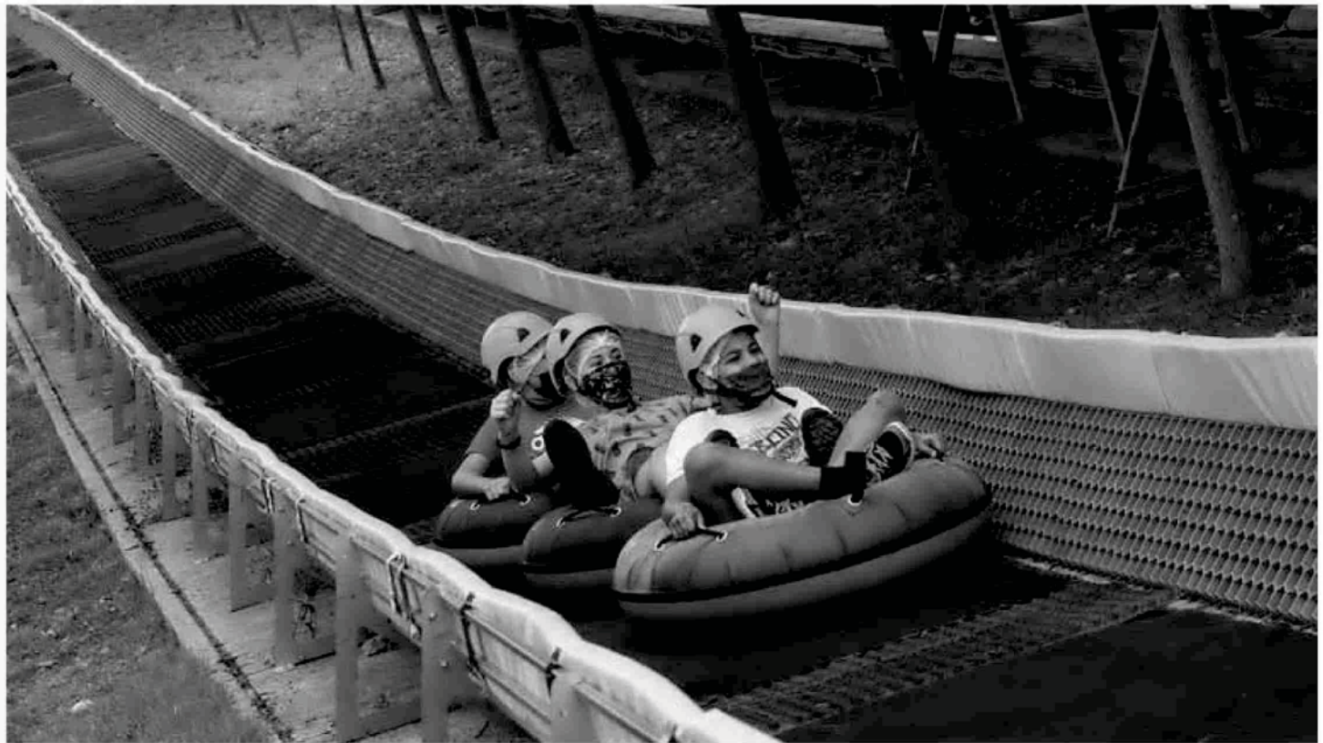
El Tubbing todos los visitantes reciben un gorro desechable y un casco que se desinfecta continuamente. Pueden lanzarse individualmente o por grupos familiares.

El parque de Arguedas obtuvo en 2020 el sello 'Safe Tourism Certified' del Instituto para la Calidad Turística Española y este año ha inaugurado su temporada de verano con dos nuevas atracciones acuáticas