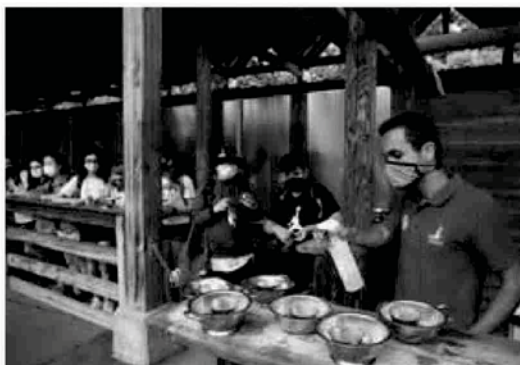
Desinfección de materiales después de cada uso.