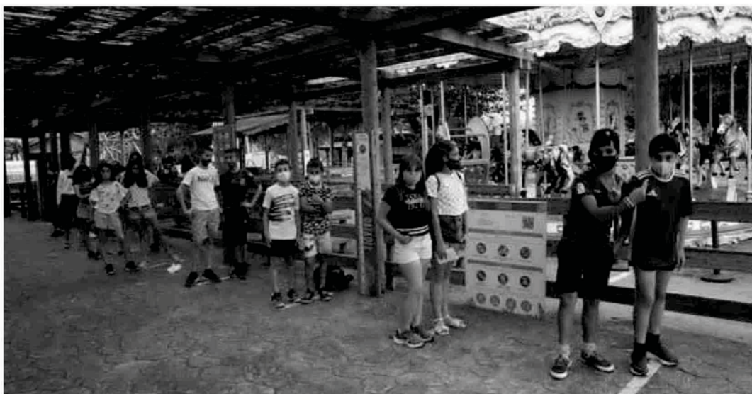
Un grupo de escolares espera su turno para montarse en el tióvivo tras las líneas amarillas que garantizan la distancia de seguridad.