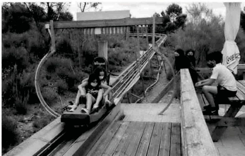
Dos niñas montadas en la atracción del Bobsleigh, el trineo ruso.

Poder disfrutar de la naturaleza nunca había sido tan sencillo en tiempos de pandemia. El parque de Arguedas ha creado caminos y sendas de sentido único y ha habilitado mamparas trans-