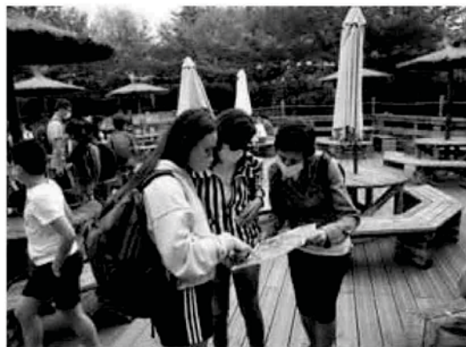
Un grupo de visitantes consulta el mapa del parque.

El aforo del parque se ha reducido al 50% y eso posibilita la entrada a 4.000 visitantes que deberán adquirir su entrada (18 a 25€) de manera online y a quienes se les aconseja pagar con tarjeta en todos los establecimientos.