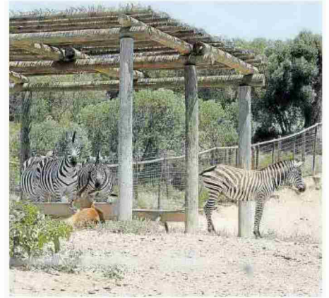
Un grupo de cebras del recinto de animales exóticos.