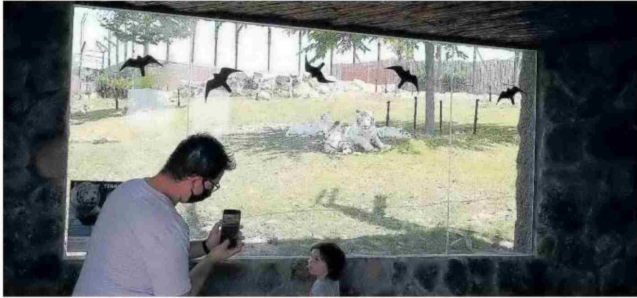
Un padre fotografiando, a través de la nueva cristalera, a su hija con los tigres blancos que nacieron el año pasado.