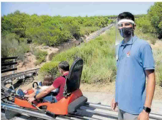
Uno de los trabajadores del parque utilizando una pantalla protectora y mascarilla.

La gran mayoría de los visitantes del parque de Sendaviva del pasado viernes procedían de la zona de la Ribera o de la comarca de Pamplona, a excepción de algún vecino de la CAV y una familia de Salamanca. ●