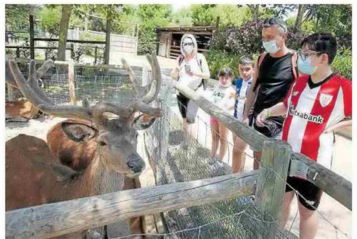
Una familia de Vitoria contempla los ciervos ubicados en la senda de los herbívoros.

Desde que el parque abrió en 2004 han aumentado el