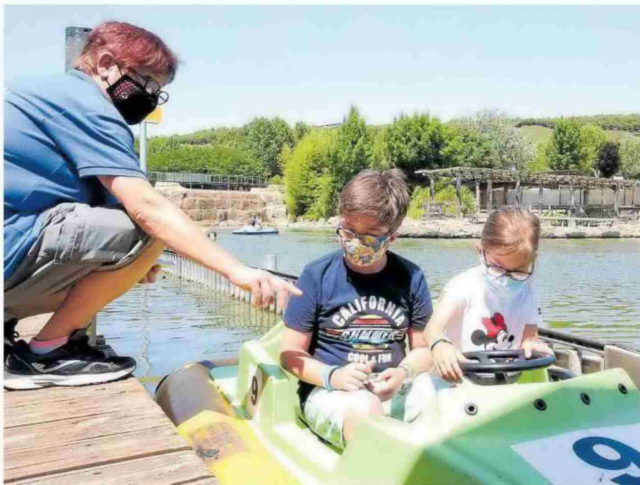
El personal de Sendaviva indica a dos niños cómo utilizar el volante de las barcas de la atracción acuática Bumpers.