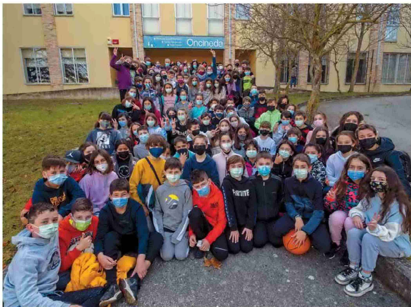
Los grupos de Noáin y Olite, junto al equipo de CNAI, el jueves en las escaleras de acceso al albergue juvenil Oncinada de Estella.