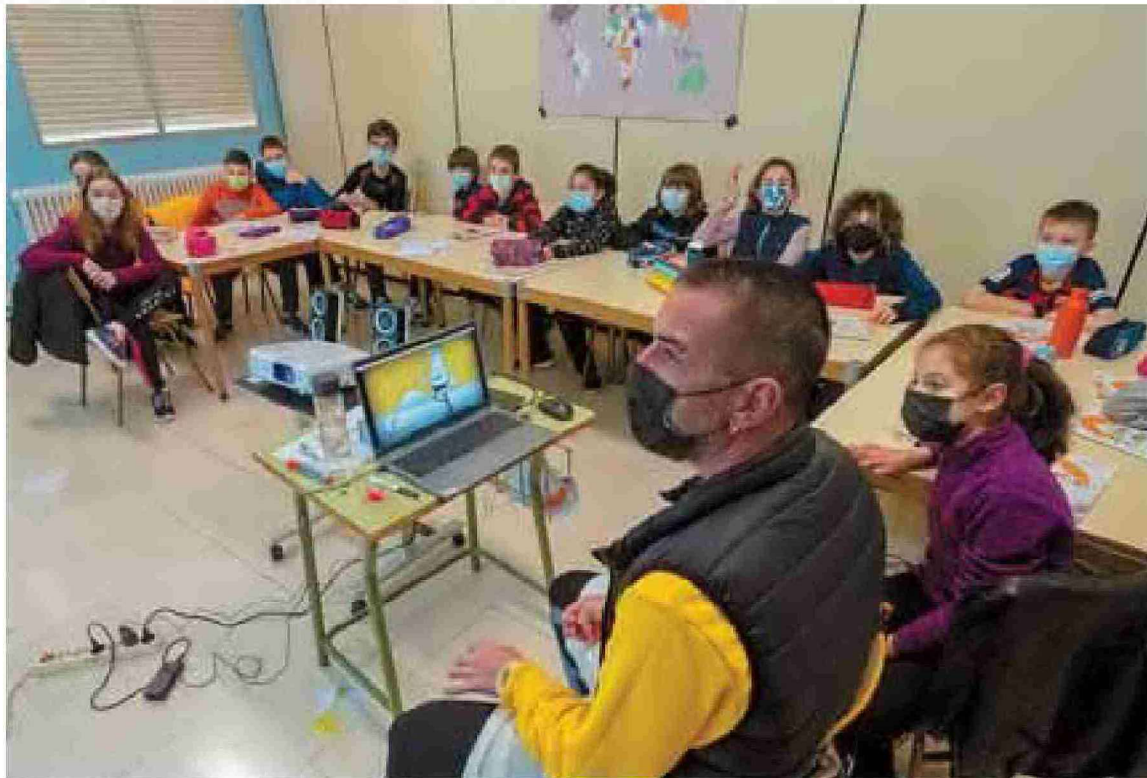
Una de las clases impartidas esta primera semana de English Week en Estella.