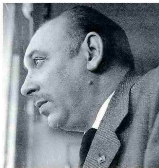
Una fotografía de archivo de Rafael García Serrano.

Según apunta Zubiaur Carreño, tanto su obra literaria como cinematográfica posee un "realismo social de carácter memorialístico" y concluye que el objetivo del libro precisamente era responder a una pregunta: "¿Qué significó para él el cine?". Y a modo de respuesta, parafrasea unas palabras del navarro: "El cine ofrece la libertad de la novela y la comunicación del teatro". Porque, concluye, él quiso "proyectar su visión de la lectura y su sensibilidad al gran público a través del cine". Con motivo de la edición de esta monografía, esta tarde, a las 19.30 horas, se proyectará la película Los ojos perdidos , en una sesión que presentará el propio Zubiaur Carreño. ●