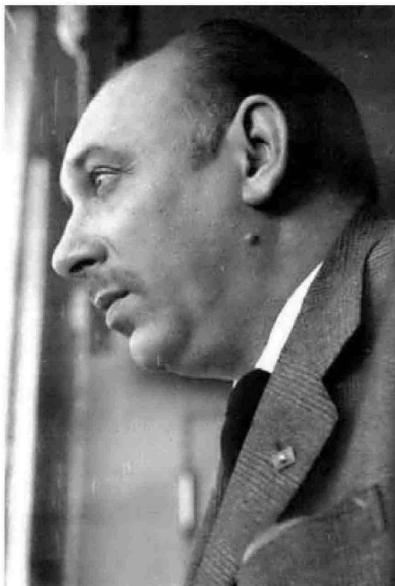
El escritor y guionista Rafael García Serrano.