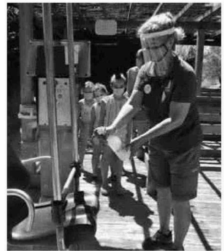
Una trabajadora desinfectando una atracción