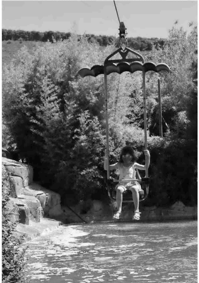
Una niña montada en la tirolina que cruza el río en el parque