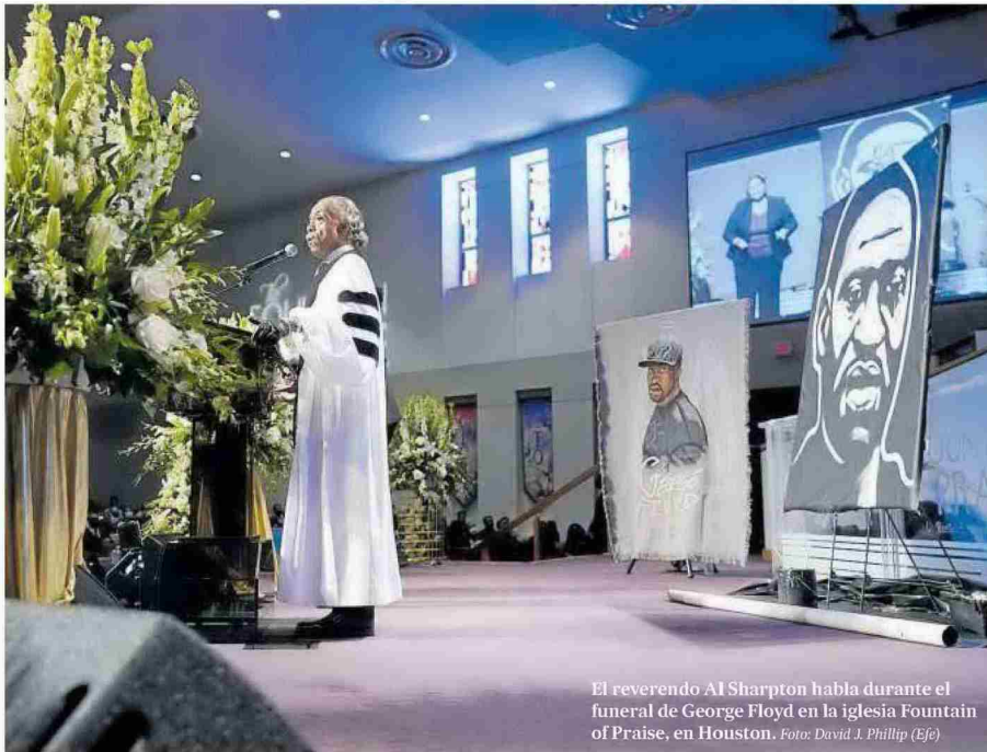
El reverendo Al Sharpton habla durante el funeral de George Floyd en la iglesia Fountain of Praise, en Houston.