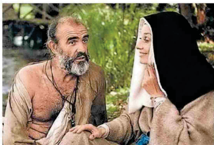
'La gran aventura de Robin y Marian'.