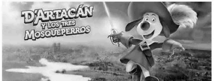
D'Artacán en la imagen promocional de la película.