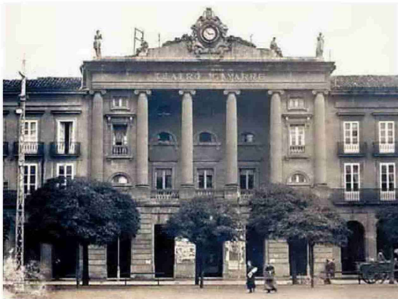
El Teatro Principal de Pamplona, lugar donde se vio por primera vez imagen en movimiento.