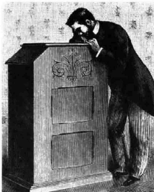
Kinetoscopio de Edison.

circulado por la empresa donde dice que es el "Kinematógrafo aparato maravilloso que permite apreciar...".