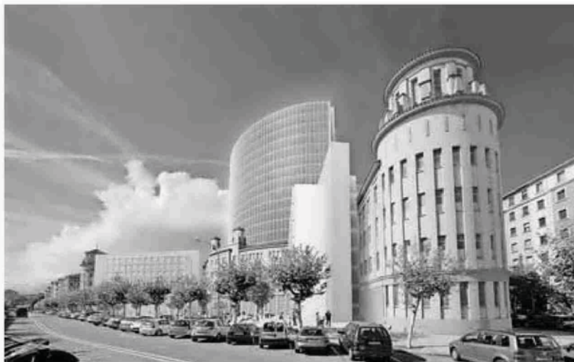
En 2013 un nuevo proyecto adosaba una torre acristalada de 20 metros de altura al edificio original. CEDIDA

El proyecto aprobado el jueves, añade dos pisos al colegio y construye dos edificios. CEDIDA