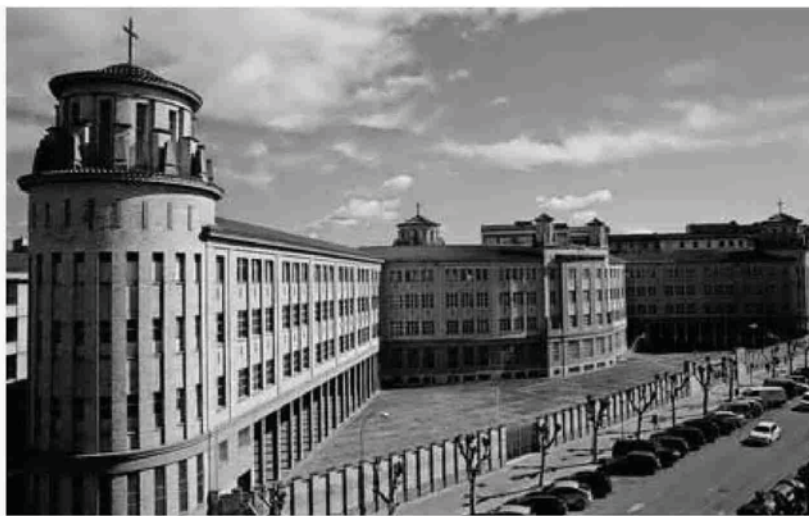
El edificio de los Maristas, obra del arquitecto Víctor Eusa, que ahora albergará viviendas.