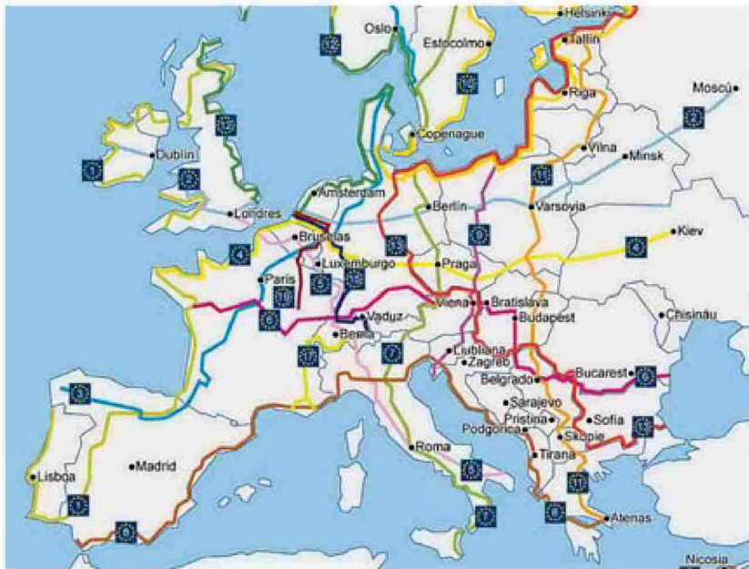
Por Navarra pasarán dos EuroVelos, la número 1 y la 3.

En Navarra se han sumado también al proyecto europeo otros 12 socios locales, entidades en las que