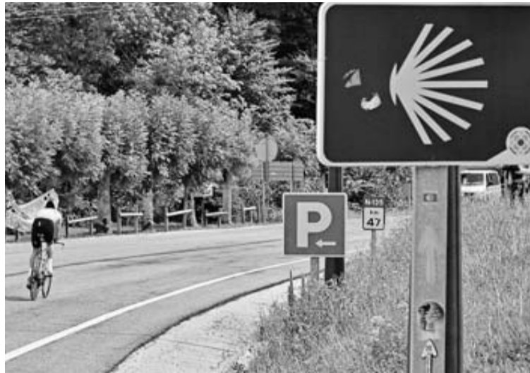
Roncesvalles, punto de unión con la ruta procedente de Francia.

La agencia navarra del territorio y la sostenibilidad Lursarea, integrada en la sociedad pública Nasuvinsa, trabajará durante los próximos dos años en el diseño y desarrollo de este proyecto, diseñado junto a otros seis socios europeos, para crear un tramo ciclado que unirá Logroño, Pam-