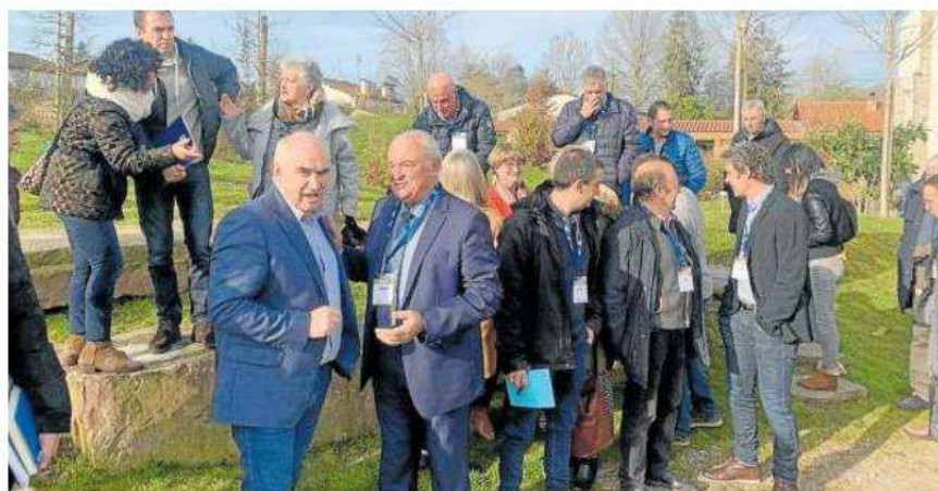
Representantes de las comunidades implicadas en la reunión de ayer en Saint-Palais.

de sectores como el turismo, y para impulsar la generación de empleo especialmente en las áreas rurales más desfavorecidas en términos de