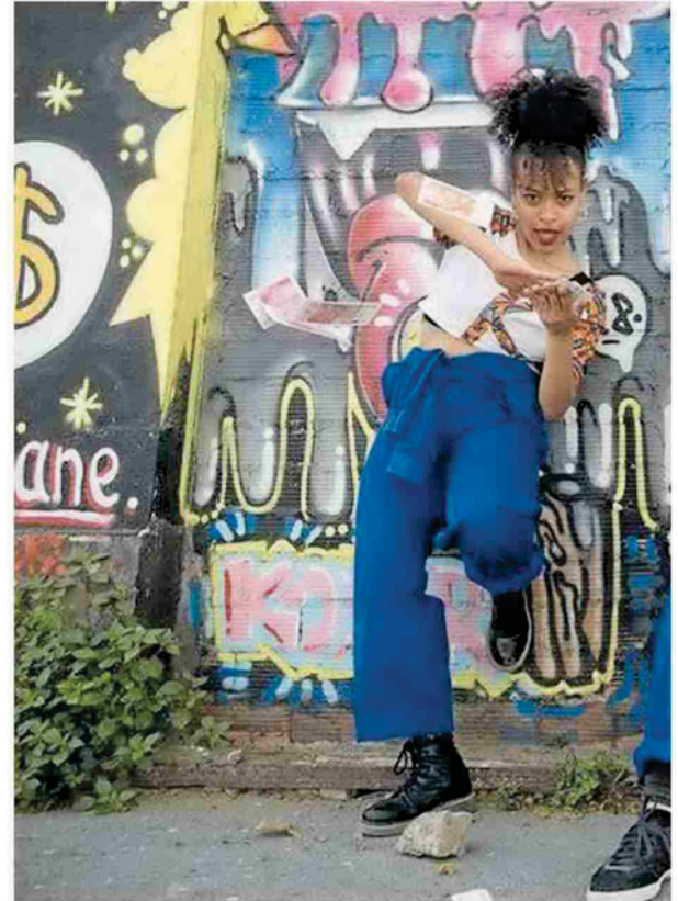
A la izquierda, los componentes de Antropoloops, que mostrará cómo se remezclan las músicas del mundo, reconociendo su origen y generando identidades nuevas a través del remix; arriba, las bailarinas de Ku'dancin Afrobeat.