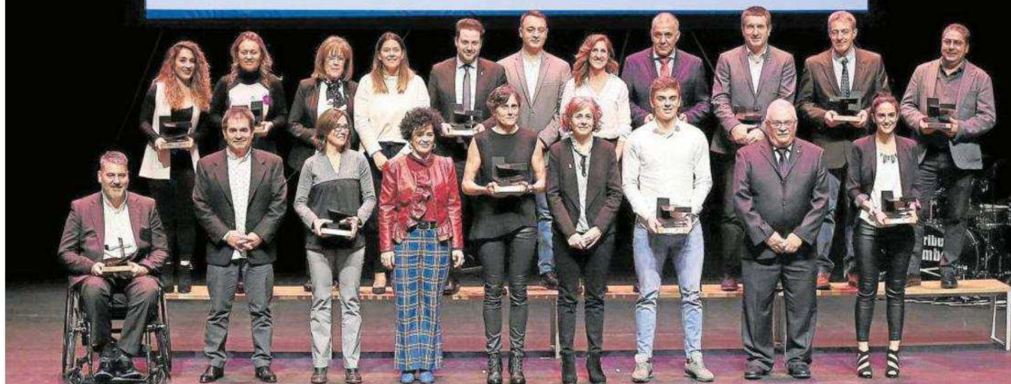
Foto de familia de todos los galardonados, que recibieron una escultura de Joseba Goldaratz como premio, denominada 'Tipi Tapa'.