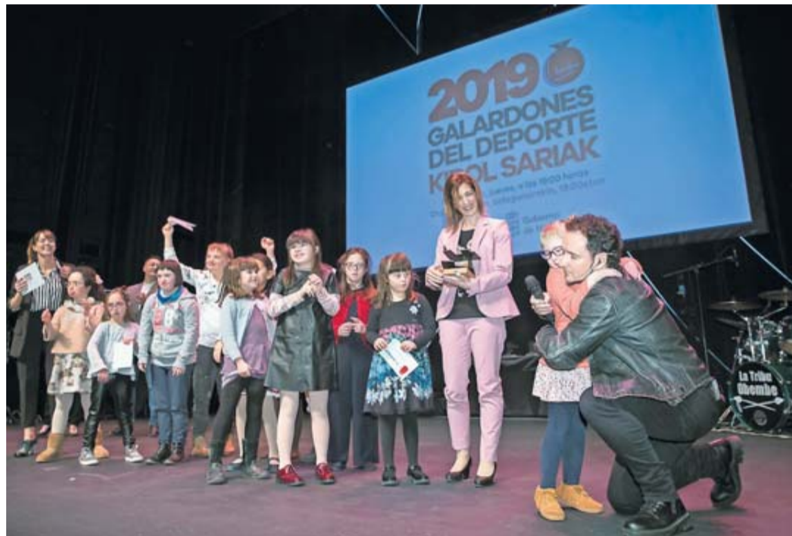
Las niñas gimnastas del CD Larraina protagonizaron el momento más emotivo de la gala.