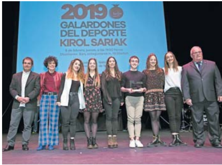
Lagunak de gimnasia recibió su premio como mejor equipo. JESÚS GARZARON