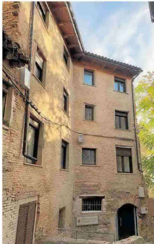
Fachada del edificio rehabilitado en la calle San Antón.

El viernes 11 se entregarán los premios a la mejor rehabilitación de 2020, que otorga el público (a través de la web municipal) y el Ayuntamiento de Tudela, para los que hay tres candidatos: una vivienda dúplex en la calle Mercadal (una inversión de 93.460 euros y 5.200 euros en ayudas), un edificio en la calle San Miguel para vivienda familiar (un presupuesto de 17.400 euros y 9.600 euros en ayudas) y la rehabilitación completa de dos edificios en la calle San Antón en los que se han creado 8 viviendas de alquiler (inversión