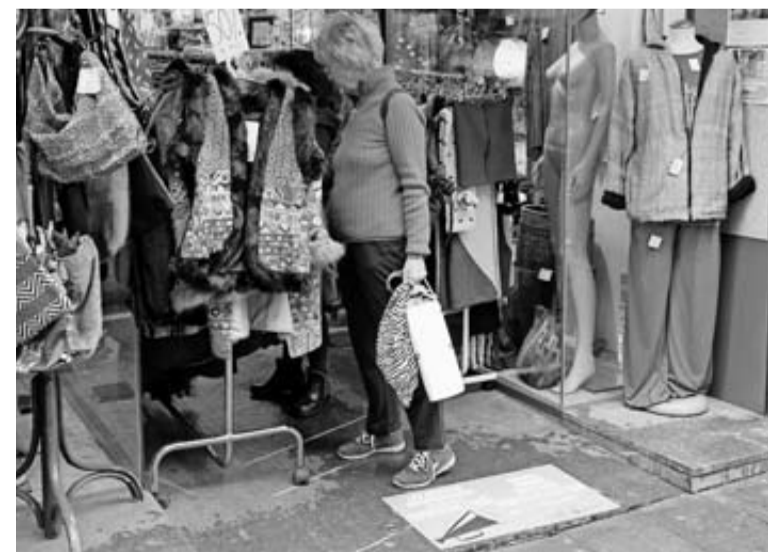
Un felpudo identifica a los comercios de Pamplona Stock.